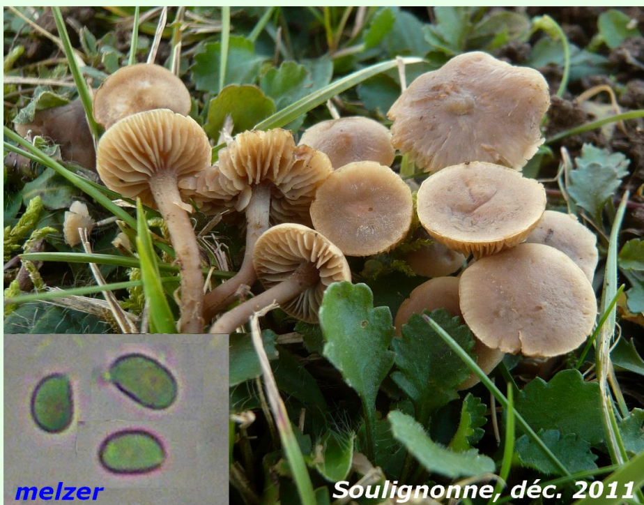
Soulignonne, déc. 2011