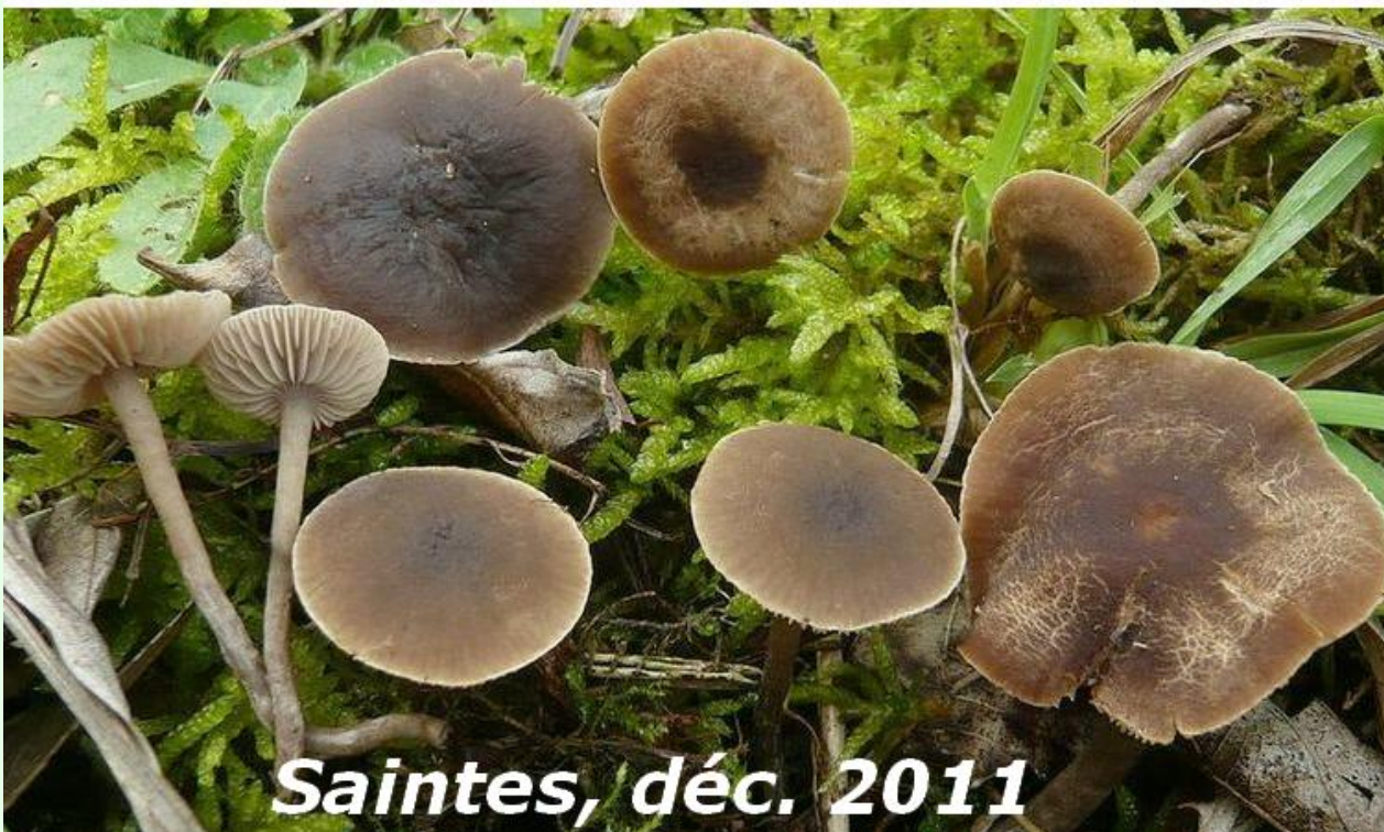
Saintes, déc. 2011