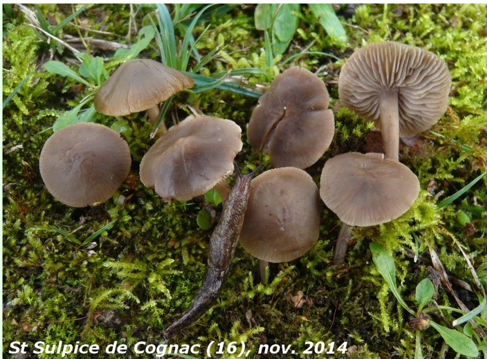
St Sulpice de Cognac (16), nov. 2014